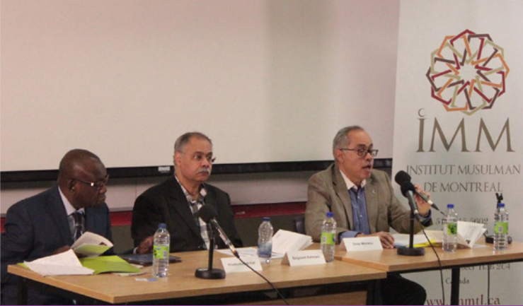
Colloque vivre ensemble, SPVM, commission permanente, étudiants médiation interculturelle