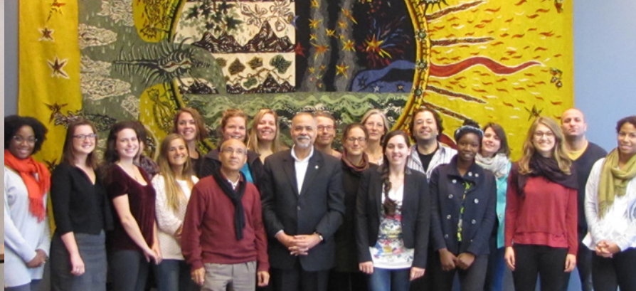
Accueil d'étudiants en médiation interculturelle